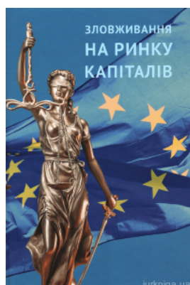
Зловживання на ринку капіталів: економіко-правові аспекти