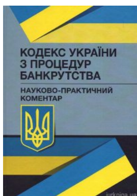
Кодекс України з процедур банкрутства. Науково-практичний коментар