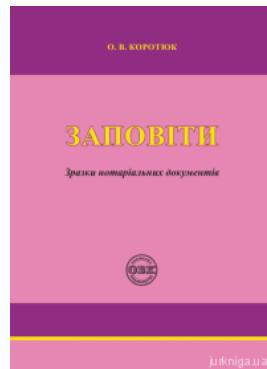
Заповіти: зразки нотаріальних документів