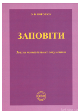
Заповіти: зразки нотаріальних документів