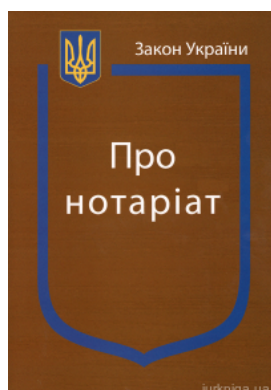
Закон України "Про нотаріат"