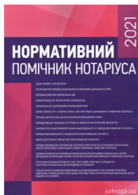
Нормативний помічник нотаріуса 2021