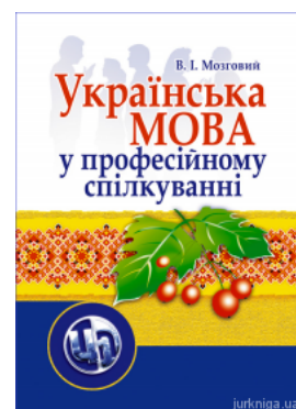
Українська мова у професійному спілкуванні. Модульний курс