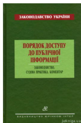
Порядок доступу до публічної інформації. Законодавство. Судова практика. Коментар