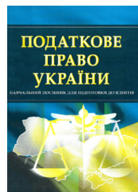
Податкове право України. Навчальний посібник для підготовки до іспитів