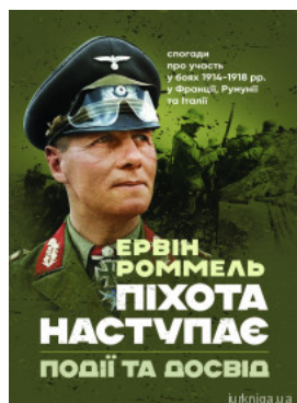
Піхота наступає. Події та досвід. Спогади про участь у боях 1914-1918 роках у Франції, Румунії та Італії