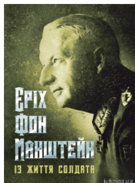
Із життя солдата