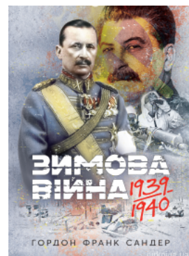
Зимова війна 1939-1940 рр.