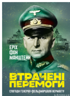
Втрачені перемоги. Спогади генерал-фельдмаршал а вермахту