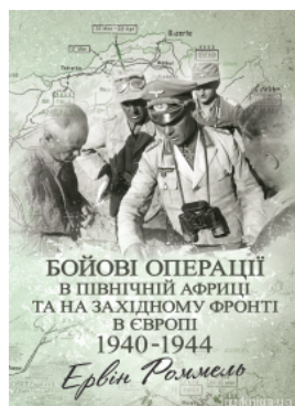
Бойові операції в Північній Африці та на Західному фронті в Європі. 1940-1944