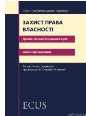
Захист права власності. Правові позиції Верховного Суду: коментарі науковців