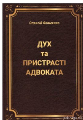
Дух та пристрасті адвоката