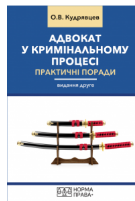
Адвокат у кримінальному процесі. Практичні поради. Видання друге

Перейти до галузі права Кримінальне право та процес