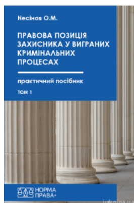
Правова позиція захисника у виграних кримінальних процесах. Том 1