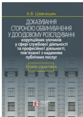
Доказування стороною обвинувачення у досудовому розслідуванні корупційних злочинів у сфері службової діяльності та професійної діяльності,...