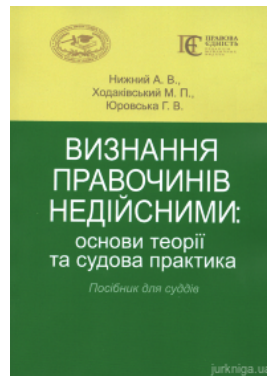
Визнання правочинів недійсними: основи теорії та судова практика. Посібник для суддів