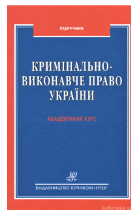
Кримінально-виконавче право України. Академічний курс