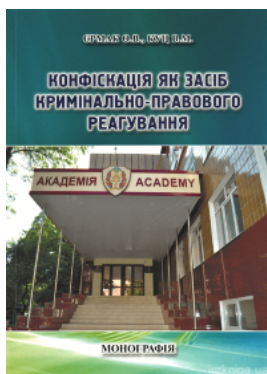
Конфіскація як засіб кримінально-правового реагування