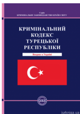
Кримінальний кодекс Турецької Республіки