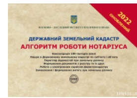
Державний земельний кадастр. Алгоритм роботи нотаріуса

Перейти до галузі права Нотаріальне право