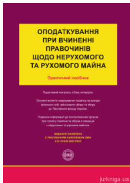
Оподаткування при вчиненні правочинів щодо нерухомого та рухомого майна