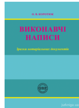
Виконавчі написи: зразки нотаріальних документів