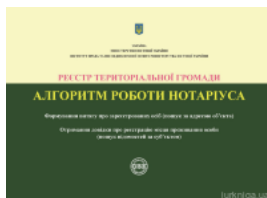
Реєстр територіальної громади. Алгоритм роботи нотаріуса