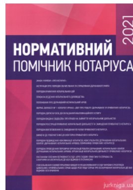
Нормативний помічник нотаріуса 2021