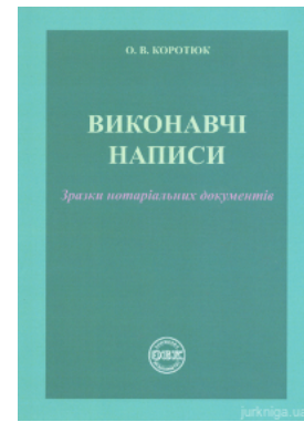
Виконавчі написи: зразки нотаріальних документів