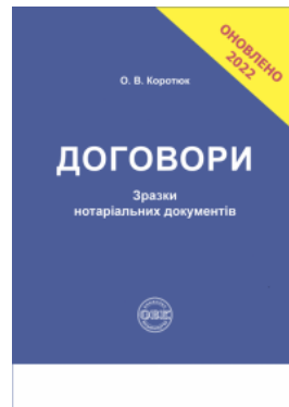
Договори: зразки нотаріальних документів