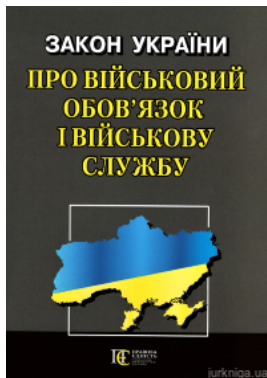
Закон України "Про військовий обов'язок і військову службу". Алерта