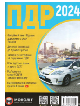
Правила дорожнього руху України 2024