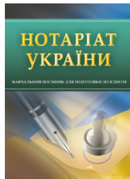
Нотаріат України. Навчальний посібник для підготовки до іспитів