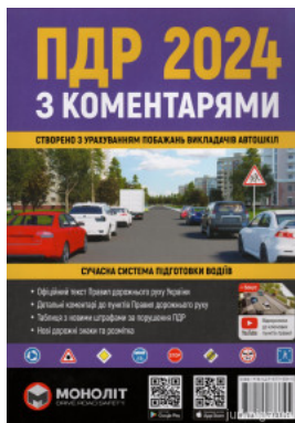
ПДР України 2024 з коментарями