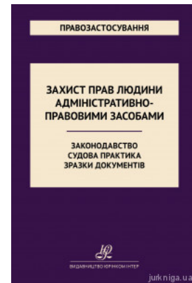
Захист прав людини адміністративно-правовими засобами. Законодавство. Судова практика. Зразки документів