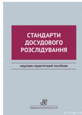
Стандарти досудового розслідування