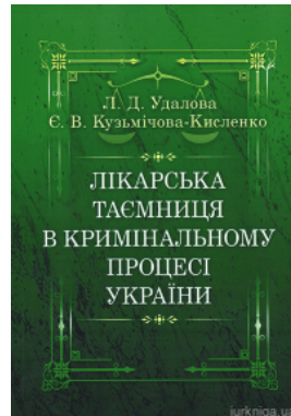
Лікарська таємниця в кримінальному процесі України