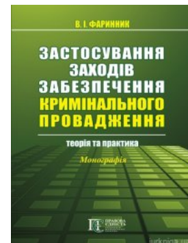
Застосування заходів забезпечення кримінального провадження: теорія та практика

Перейти до галузі права Кримінальне право та процес