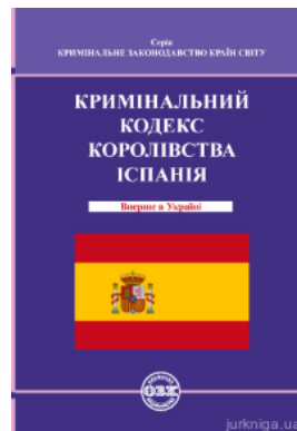
Кримінальний кодекс Королівства Іспанія