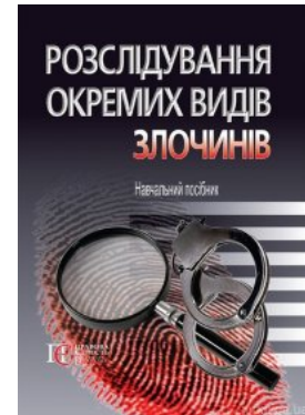
Розслідування окремих видів злочинів. Навчальний посібник