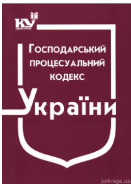
Господарський процесуальний кодекс України