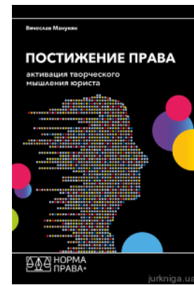
Постигание права. Активация творческого мышления юриста

Перейти до галузі права Корпоративне право