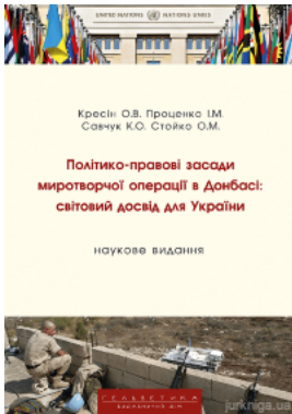
Політико-правові засади миротворчої операції в Донбасі: світовий досвід для України