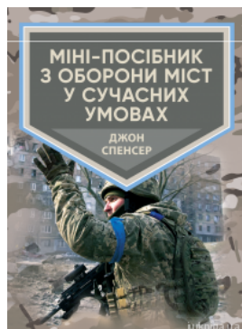
Міні-посібник з оборони міст у сучасних умовах