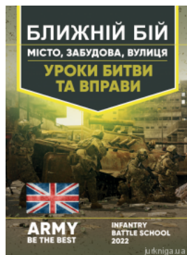
Ближній бій. Місто, забудова, вулиця. Уроки битви та вправи