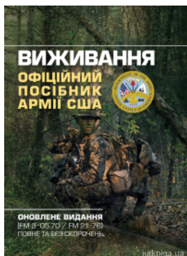
Виживання. Офіційний посібник армії США