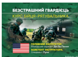
Безстрашний гвардієць. Курс бійця-рятувальника