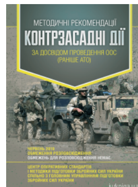
Методичні рекомендації "Контрзасадні дії" (за досвідом проведення ООС (раніше АТО))