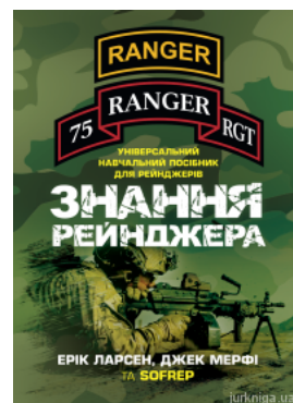
Знання рейнджера. Універсальний навчальний посібник для рейнджерів