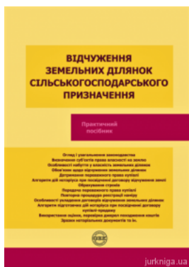
Відчуження земельних ділянок сільськогосподарського призначення