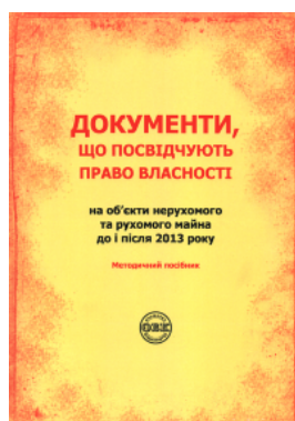
Документи, що посвідчують право власності на об'єкти нерухомого та рухомого майна до і після 2013 року