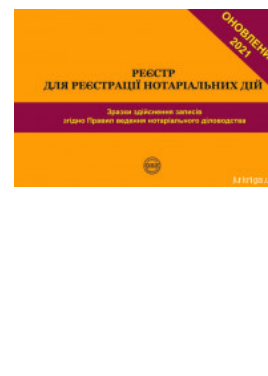
Реєстр для реєстрації нотаріальних дій. Зразки здійснення записів згідно Правил ведення нотаріального діловодства

Перейти до галузі права Нотаріальне право