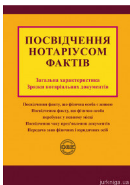
Посвідчення нотаріусом фактів: загальна характеристика, зразки нотаріальних документів