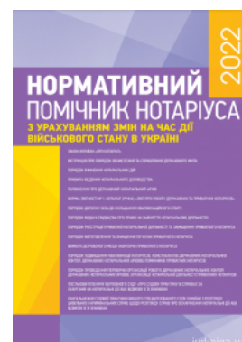
Нормативний помічник нотаріуса 2022