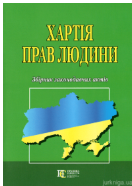
Хартія прав людини. Збірник законодавчих актів. Алерта