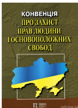
Конвенція про захист прав людини і основоположних свобод. Збірник законодавчих актів. Алерта