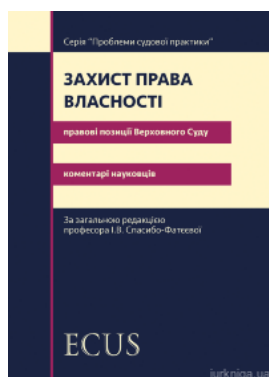
Захист права власності. Правові позиції Верховного Суду: коментарі науковців