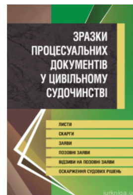
Зразки процесуальних документів у цивільному судочинстві. Листи, скарги, заяви, відзиви на позовні заяви, оскарження судових рішень.

Перейти до галузі права Цивільне право та процес