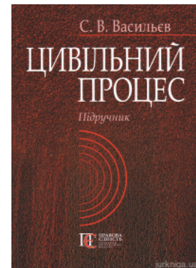
Цивільний процес. Підручник