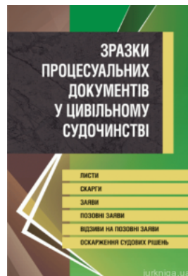
Зразки процесуальних документів у цивільному судочинстві. Листи, скарги, заяви, відзиви на позовні заяви, оскарження судових рішень.