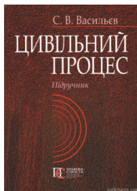
Цивільний процес. Підручник