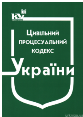
Цивільний процесуальний кодекс України