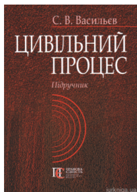
Цивільний процес. Підручник