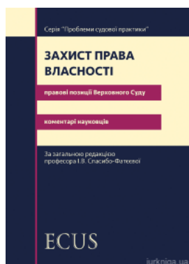
Захист права власності. Правові позиції Верховного Суду: коментарі науковців