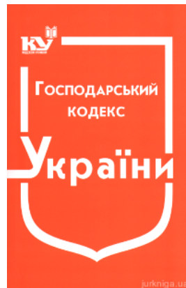
Господарський кодекс України