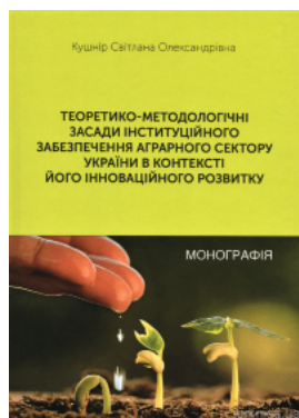
Теоретико-методологіч ні засади інституційного забезпечення аграрного сектору України в контексті його інноваційного розвитку