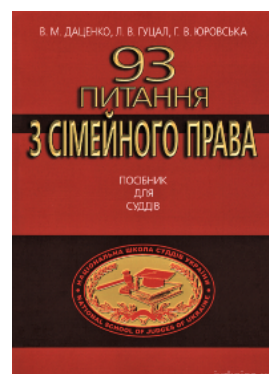
93 питання з сімейного права. Посібник для суддів