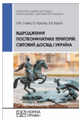
Відродження постконфліктних територій: світовий досвід і Україна