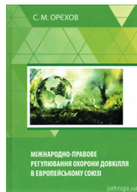
Міжнародно-правове регулювання охорони довкілля в Європейському союзі

Перейти до галузі права Цивільне право та процес