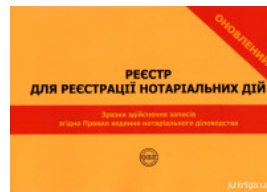
Реєстр для реєстрації нотаріальних дій. Зразки здійснення записів згідно Правил ведення нотаріального діловодства