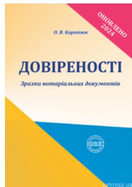
Довіреності: зразки нотаріальних документів