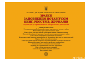
Зразки заповнення нотаріусом книг, реєстрів, журналів

Перейти до галузі права Нотаріальне право