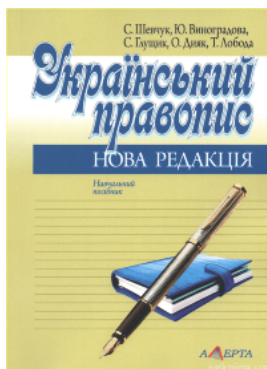
Український правопис: нова редакція. Навчальний посібник