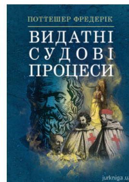
Видатні судові процеси

Перейти до галузі права Ділове письмо та етика