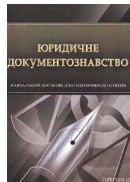
Юридичне документознавство. Навчальний посібник для підготовки до іспитів