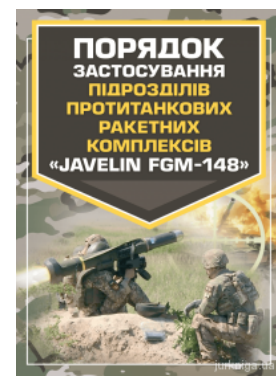
Порядок застосування підрозділів протитанкових ракетних комплексів "Javelin FGM-148"

Перейти до галузі права Ділове письмо та етика