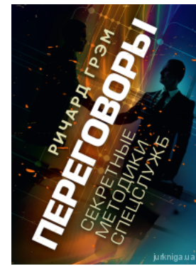
Переговори. Секретні методики спецслужб