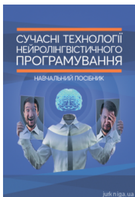
Сучасні технології нейролінгвістичного програмування