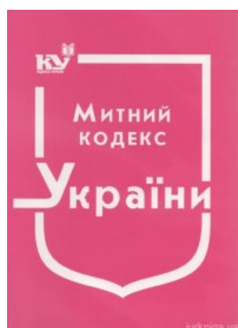
Митний кодекс України