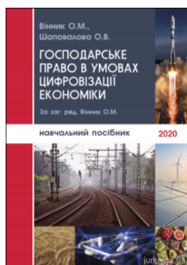
Господарське право в умовах цифровізації економіки