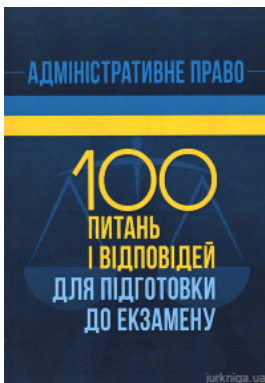
Адміністративне право. 100 питань і відповідей для підготовки до екзамену