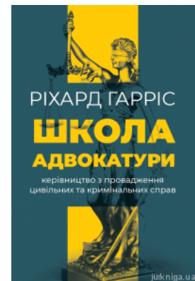
Школа адвокатури. Керівництво з провадження цивільних та кримінальних справ