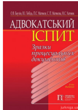
Адвокатський іспит: зразки процесуальних документів