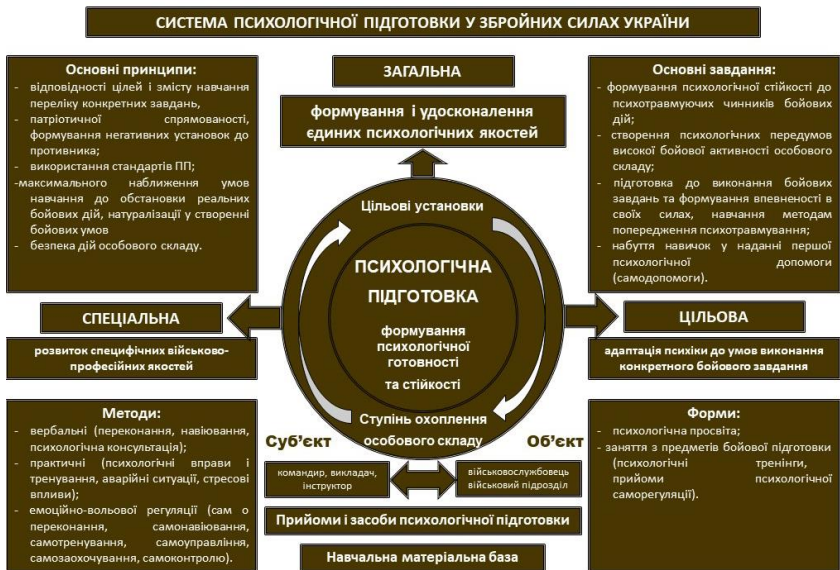
Схема 1.1. Система психологічної підготовки у Збройних Силах України.

Сутністю психологічної підготовки є формування психологічної готовності і стійкості; перетворення чинників бою в знайомі, звичні, очікувані (адаптування); оволодіння військовослужбовцями необхідними знаннями у подоланні психологічних навантажень; розвиток у особового складу здатності швидко перебудуватись відповідно до обставин.