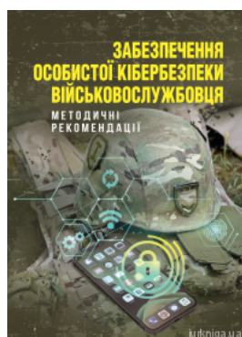
Забезпечення особистої кібербезпеки військовослужбовця