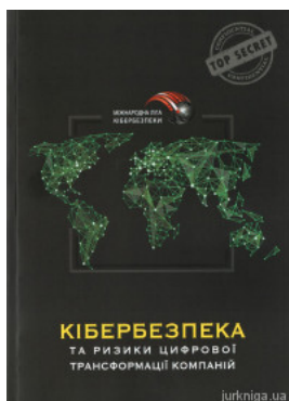
Кібербезпека та ризики цифрової трансформації компаній