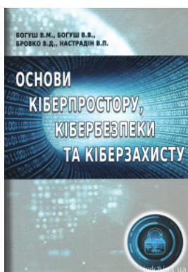
Основи кіберпростору, кібербезпеки та кіберзахисту