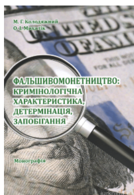
Фальшивомонетництво : кримінологічна характеристика, детермінація, запобігання