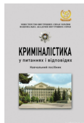
Криміналістика у питаннях і відповідях