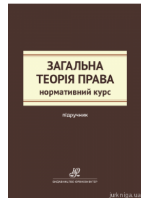
Загальна теорія права. Нормативний курс

Перейти до галузі права Адміністративне право