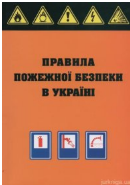
Правила пожежної безпеки в Україні