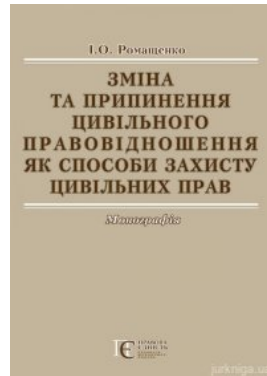
Зміна та припинення цивільного правовідношення як способи захисту цивільних прав. Монографія