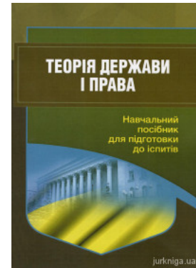
Теорія держави і права. Навчальний посібник для підготовки до іспитів