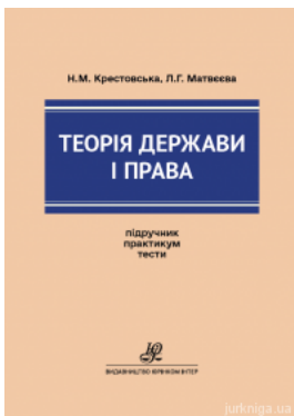
Теорія держави і права. Підручник. Практикум. Тести