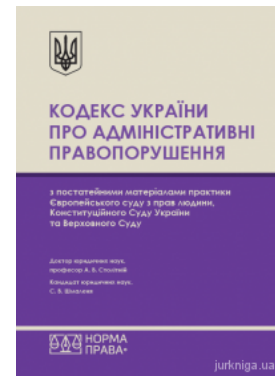
Кодекс України про адміністративні правопорушення з постійними матеріалами практики Європейського суду з прав людини, Конституційного Суду...