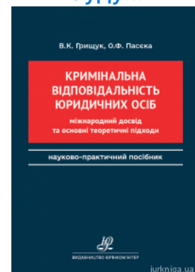
Кримінальна відповідальність юридичних осіб: міжнародний досвід та основні теоретичні підходи

Перейти до галузі права Кримінальне право та процес