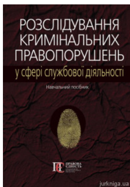
Розслідування кримінальних правопорушень у сфері службової діяльності