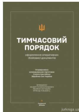
Тимчасовий порядок оформлення оперативних (бойових) документів (Наказ №140)