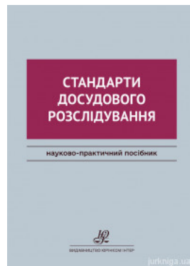
Стандарти досудового розслідування