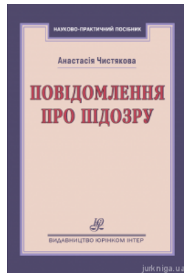
Повідомлення про підозру