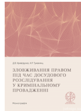
Зловживання правом під час досудового розслідування у кримінальному провадженні