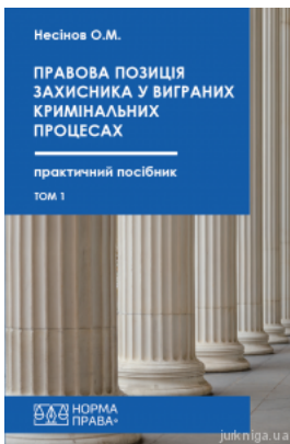
Правова позиція захисника у виграних кримінальних процесах. Том 1