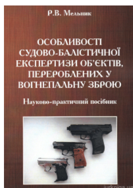
Особенности судовой-баллистической экспертизы объектов, переработанных у огнестрельное оружие