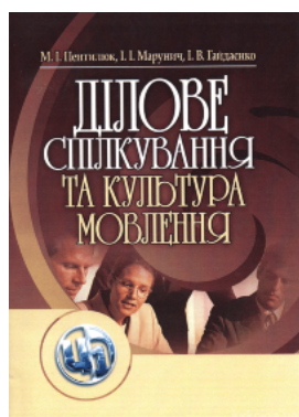
Ділове спілкування та культура мовлення