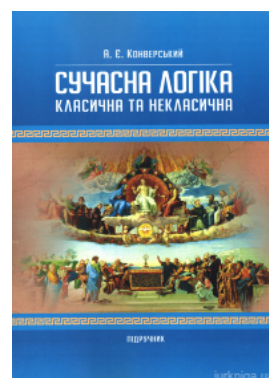
Сучасна логіка (класична та некласична)

Перейти до галузі права Теорія держави і права