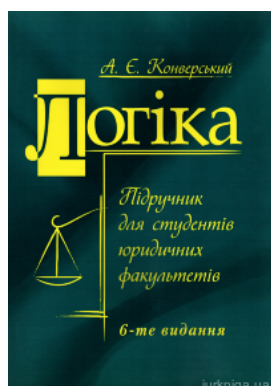
Логіка. Підручник для студентів юридичних факультетів