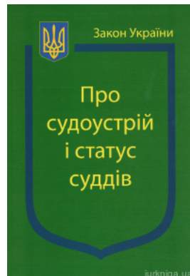
Закон України "Про судоустрій і статус суддів"