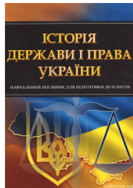
Історія держави і права України. Навчальний посібник для підготовки до іспитів