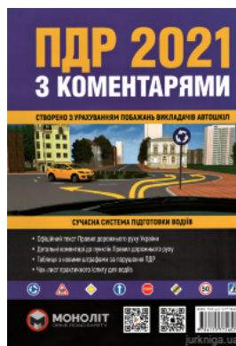
ПДР України 2021 з коментарями