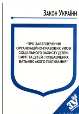
Закон України “Про забезпечення організаційно-правових умов соціального захисту дітей-сиріт та дітей, позбавлених батьківського піклування”