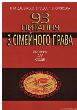
93 питання з сімейного права. Посібник для суддів