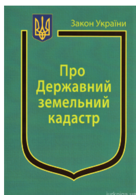
Закон України "Про Державний земельний кадастр"