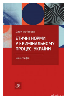
Етичні норми у кримінальному процесі України