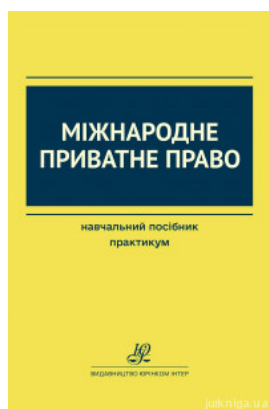
Міжнародне приватне право. Навчальний посібник. Практикум