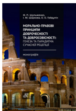
Морально-правові принципи доброчесності та добросовісності: генеза та парадигма сучасної рецепції