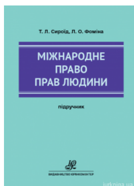
Міжнародне право прав людини