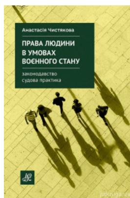
Права людини в умовах воєнного стану. Законодавство. Судова практика