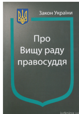
Закон України "Про Вищу раду правосуддя"