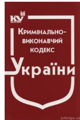
Кримінально-виконавчий кодекс України