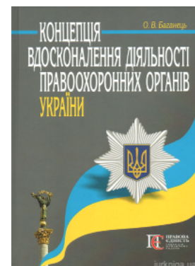
Концепція вдосконалення діяльності правоохоронних органів України

Перейти до галузі права Кримінальное право и процесс