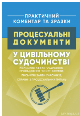
Процесуальні документи у цивільному судочинстві: письмові заяви учасників провадження по суті справи, письмові заяви учасників, справи із...