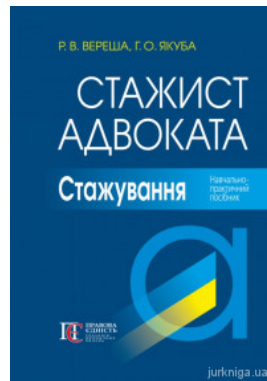
Стажист адвоката. Стажування. Навчально-практичний посібник