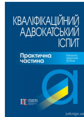
Кваліфікаційний адвокатський іспит. Практична частина