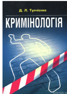
Кримінологія. Навчальний посібник для підготовки до іспитів