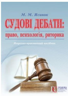
Судові дебати: право, психологія, риторика