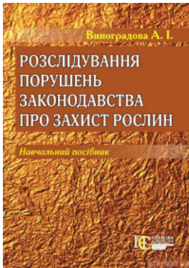
Розслідування порушень законодавства про захист рослин