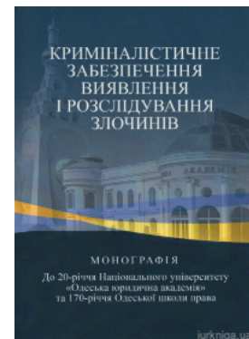
Криміналістичне забезпечення виявлення і розслідування злочинів

Перейти до галузі права Кримінальне право та процес