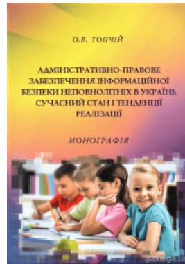
Адміністративно-право ве забезпечення інформаційної безпеки неповнолітніх в Україні: сучасний стан і тенденції реалізації