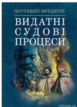
Видатні судові процеси