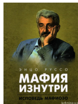
Мафія изнутри. Исповедь мафиозо