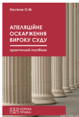
Апеляційне оскарження вироку суду. Практичний посібник