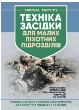
Техніка засідки для малих піхотних підрозділів