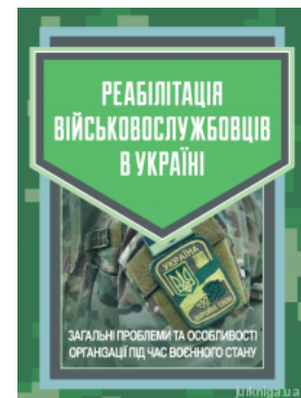
Реабілітація військовослужбовців в Україні. Загальні проблеми та особливості організації під час воєнного стану