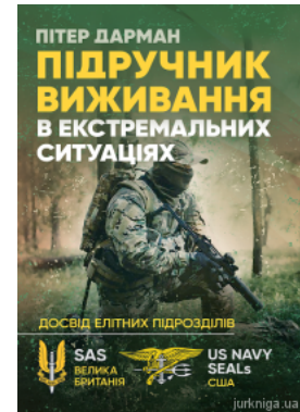
Підручник виживання в екстремальних ситуаціях. Досвід спеціальних підрозділів світу