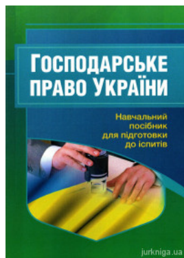
Господарське право України. Навчальний посібник для підготовки до іспитів