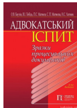
Адвокатський іспит: зразки процесуальних документів