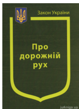
Закон України "Про дорожній рух"