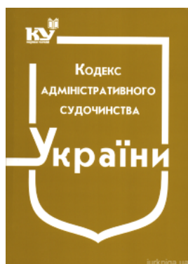
Кодекс адміністративного судочинства України