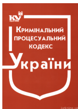
Кримінальний процесуальний кодекс України