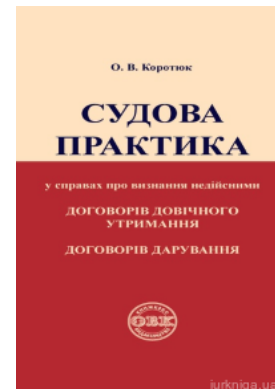
Судова практика у справах про визнання недійсними договорів довічного утримання, договорів дарування