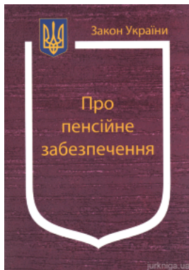
Закон України "Про пенсійне забезпечення"