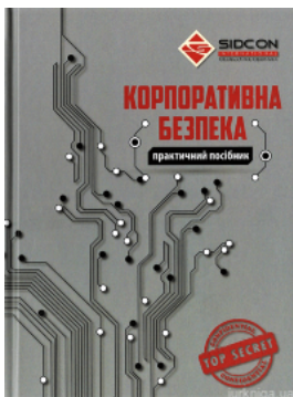
Корпоративна безпека. Практичний посібник