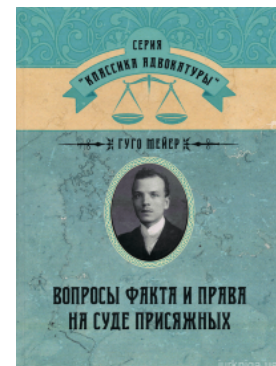
Вопросы факта и права на суде присяжных

Перейти до галузі права Інтелектуальна власність