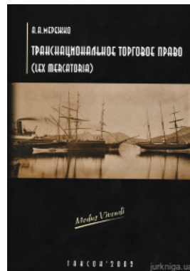
Транснаціональне торгове право (Lex mercatoria)