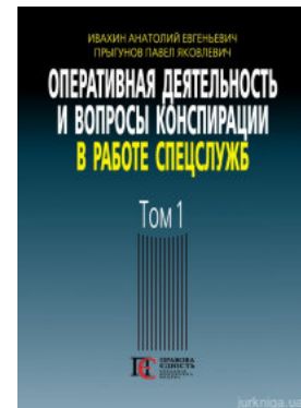
Оперативная деятельность и вопросы конспирации в работе спецслужб. Том 1