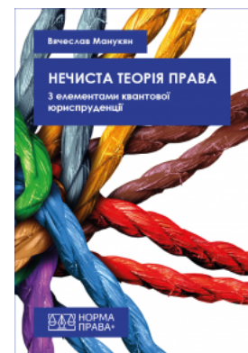
Нечиста теорія права. 3 елементами квантової юриспруденції

Перейти до галузі права Філософія та психологія права