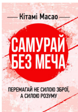
Самурай без меча. Перемагай не силою зброї, а силою розуму