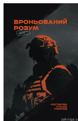
Броньований розум. Бойовий стрес та психологія екстремальних ситуацій