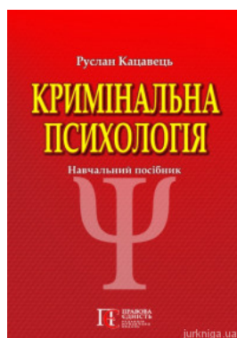
Кримінальна психологія. Навчальний посібник