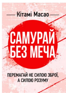
Самурай без меча. Перемагай не силою зброї, а силою розуму