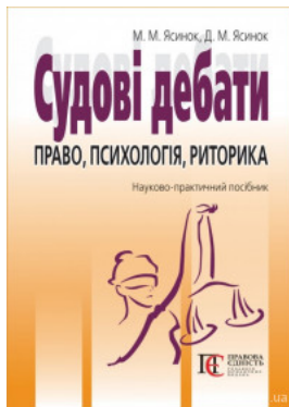
Судові дебати: право, психологія, риторика. Видання третє