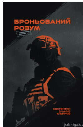
Броньований розум. Бойовий стрес та психологія екстремальних ситуацій