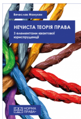
Нечиста теорія права. 3 елементами квантової юриспруденції