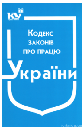
Кодекс законів про працю України