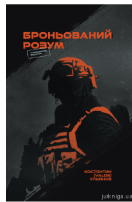
Броньований розум. Бойовий стрес та психологія екстремальних ситуацій