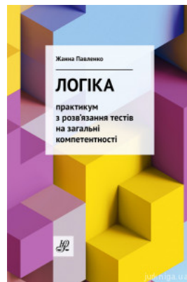
Логіка: практикум з розв'язання тестів на загальні компетентності