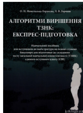
Алгоритми вирішення ТЗНК: експрес-підготовка